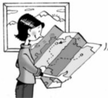
Está cerca, pero en el plano parece lejos.