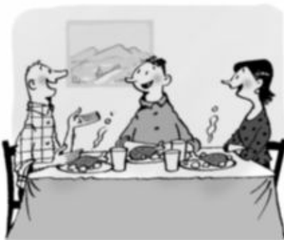
Aquí hablan mucho y comen poco.

14 Subraya los adverbios y rodea las conjunciones.