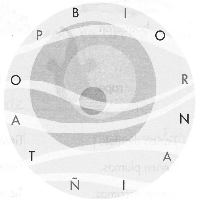
Peces de mar